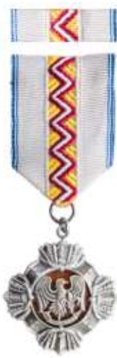
Ustava Sõpruse märk