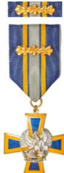
NK Teeneteristi I klass