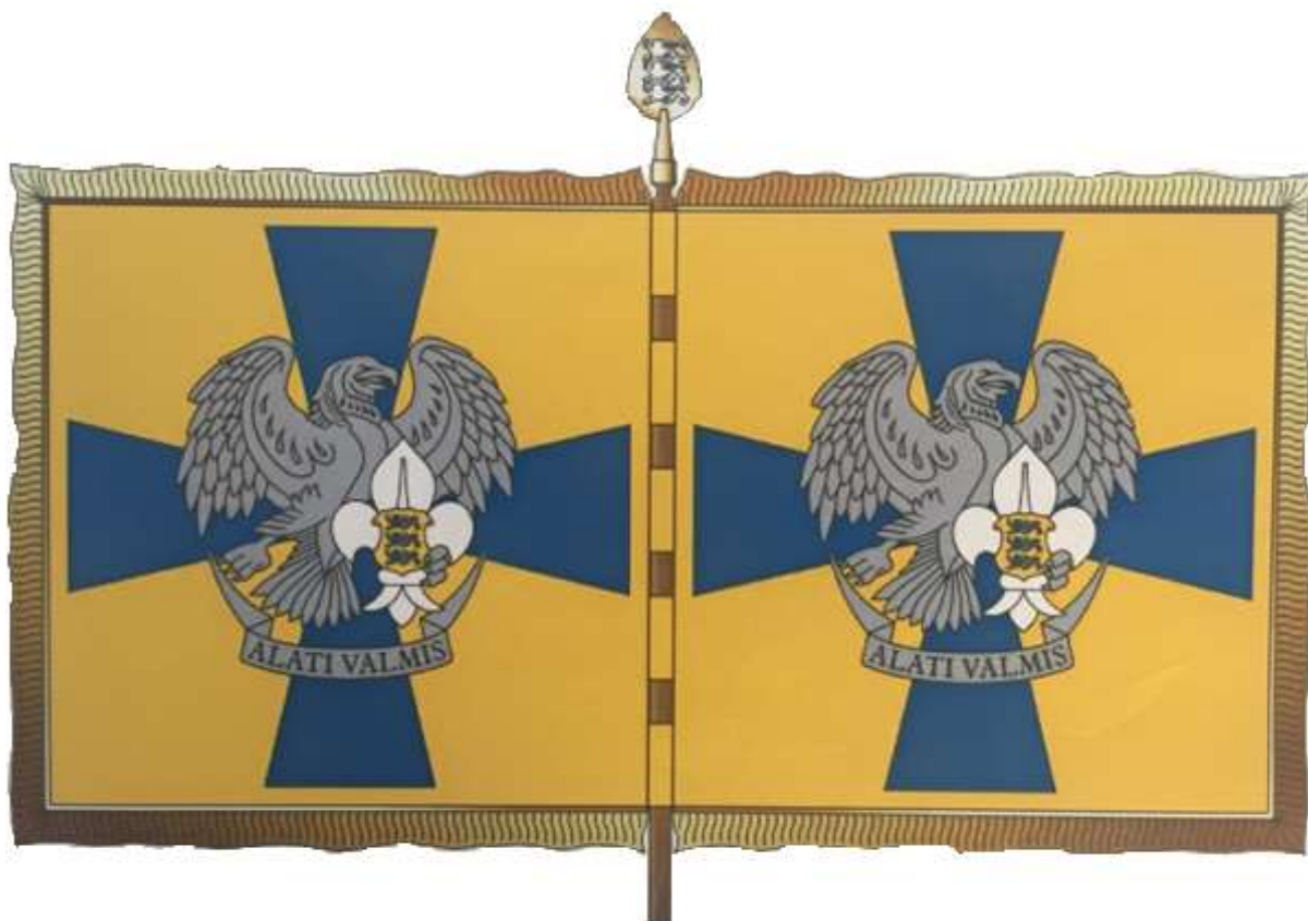
Noorte Kotkaste maleva lipp tüüplahendus (muutub maakonna vapp, NK Viru maleva lipp)