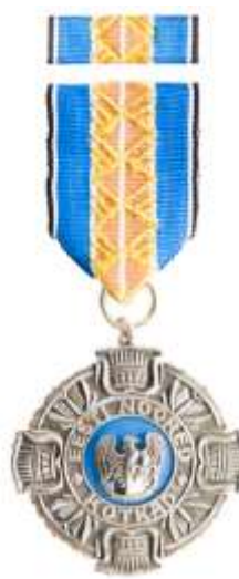
Rahvaste Sõpruse medal