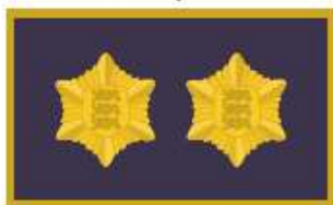
Peavanema abi maleva pealik