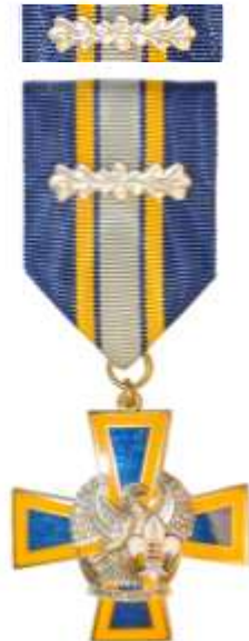
NK Teeneteristi II klass