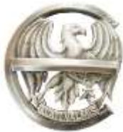
Eeskujuliku noorkotka märk