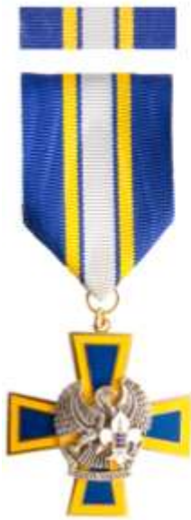
NK Teeneteristi III klass