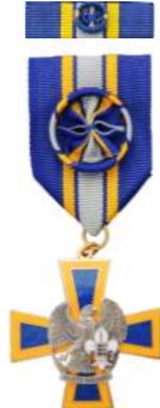
NK Teeneteristi eriklass